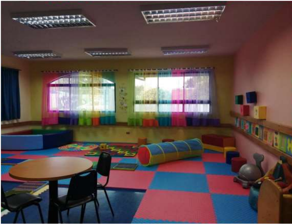
Sala de estimulación multisensorial